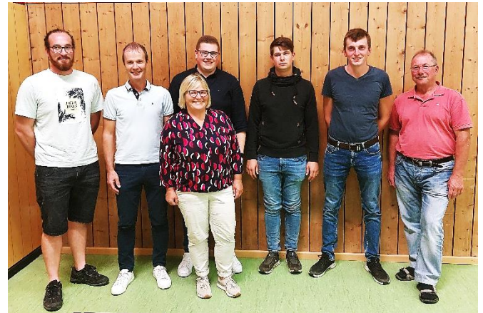
Das Bild zeigt die neu gewählte Vorstandschaft

Die Gemeinde Westerheim gratuliert der neuen Vorstandschaft und freut sich auf eine gute Zusammenarbeit. Wir danken allen, die sich zur Wahl gestellt haben und so aktiv an der Gemeindeentwicklung mitwirken.