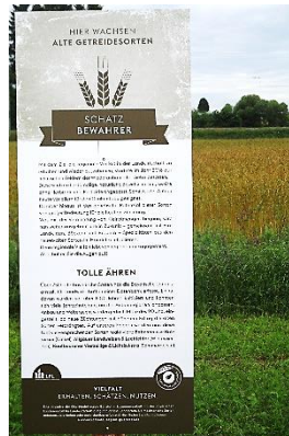
Schilder machen darauf aufmerksam, dass alte Getreidesorten wieder auf heimischen Feldern wachsen