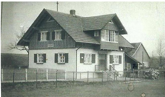
Xaver und Thea Bail, Hauptstr. 49

Sie errichteten 1936 ein neues Haus mit einem Laden für Kolonialwaren.