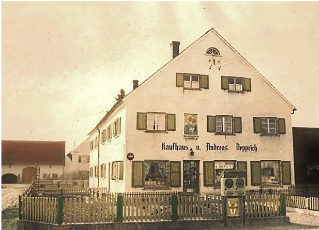
Laden von 1949-1979, jetzt Getränkemarkt