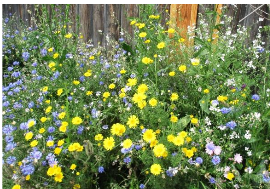
Der Juli gibt zum Einstand ein Gartenfest