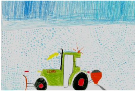
Andreas Mauer und Michael Königsberger, ehemals Grundschule Westerheim

Schnee ist am Rand der Fahrbahn oder auf dem Grundstück zu lagern, nicht jedoch auf die Fahrbahn zu bringen. Einläufe für Straßenwasser, Hydranten und Wasserabsperrschieber müssen freigehalten werden. Leider wird der gemeindliche Winterdienst immer wieder durch parkende Fahrzeuge am Straßenrand erschwert bzw. sogar verhindert. Wir bitten die