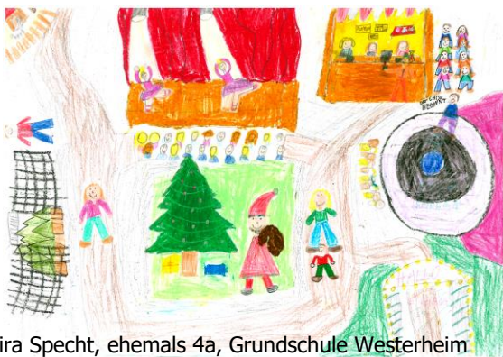
Samira Specht, ehemals 4a, Grundschule Westerheim

Was erwarten wir? Welche Erwartungen sollen, wollen wir erfüllen im Advent?