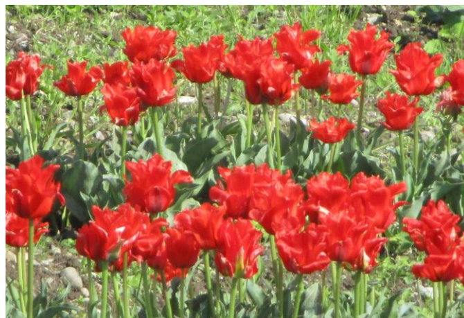
Eine rote Tulpenpracht ziert den gemeindlichen Friedhof.